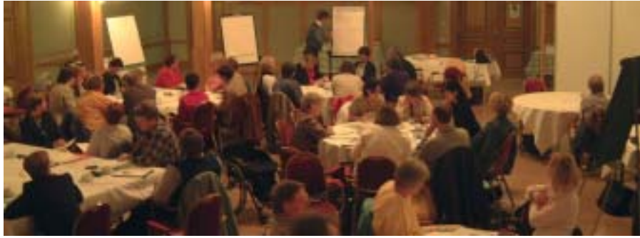
Ett nämndkontor (60 personer) ställer diagnos på sig själva med hjälp av Organisationsbarometern samt upprättar handlingsplaner i direkt samverkan med ledningen.