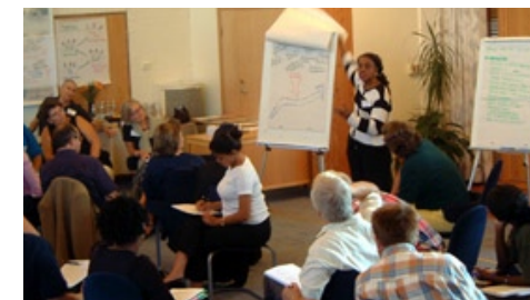
Kartläggning, kreativt skapande, införande, utvärdering.

Så skapas resultat i jämställdhetsarbetet!